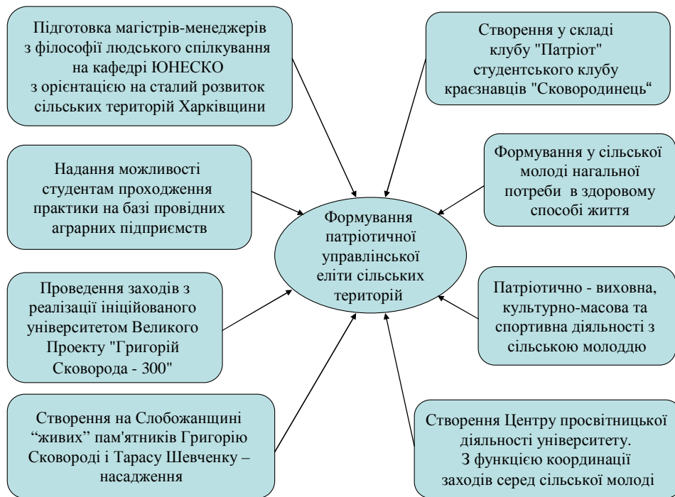
Рис.7 Структурна схема формування патріотичної управлінської еліти сільських територій

6.1.3. Забезпечувати можливість всім студентам денної форми навчання проходити практику на базі провідних аграрних підприємств.