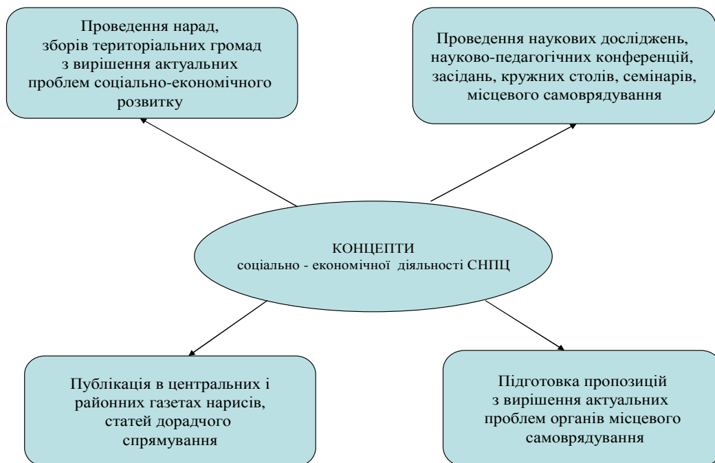
Рис. 4 Структурна схема соціально-економічної діяльності СНПЦ

4.1.2. З метою визначення актуальних проблем органів місцевого самоврядування і розробки пропозицій щодо їх усунення скласти і реалізувати щорічний графік відвідування сільських і селищних рад викладачами і студентами університету і академії.