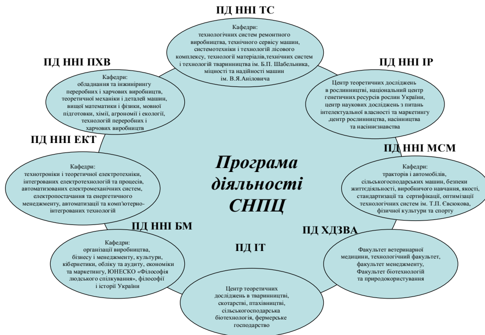
Рис.2 Програмна модель діяльності СНПЦ