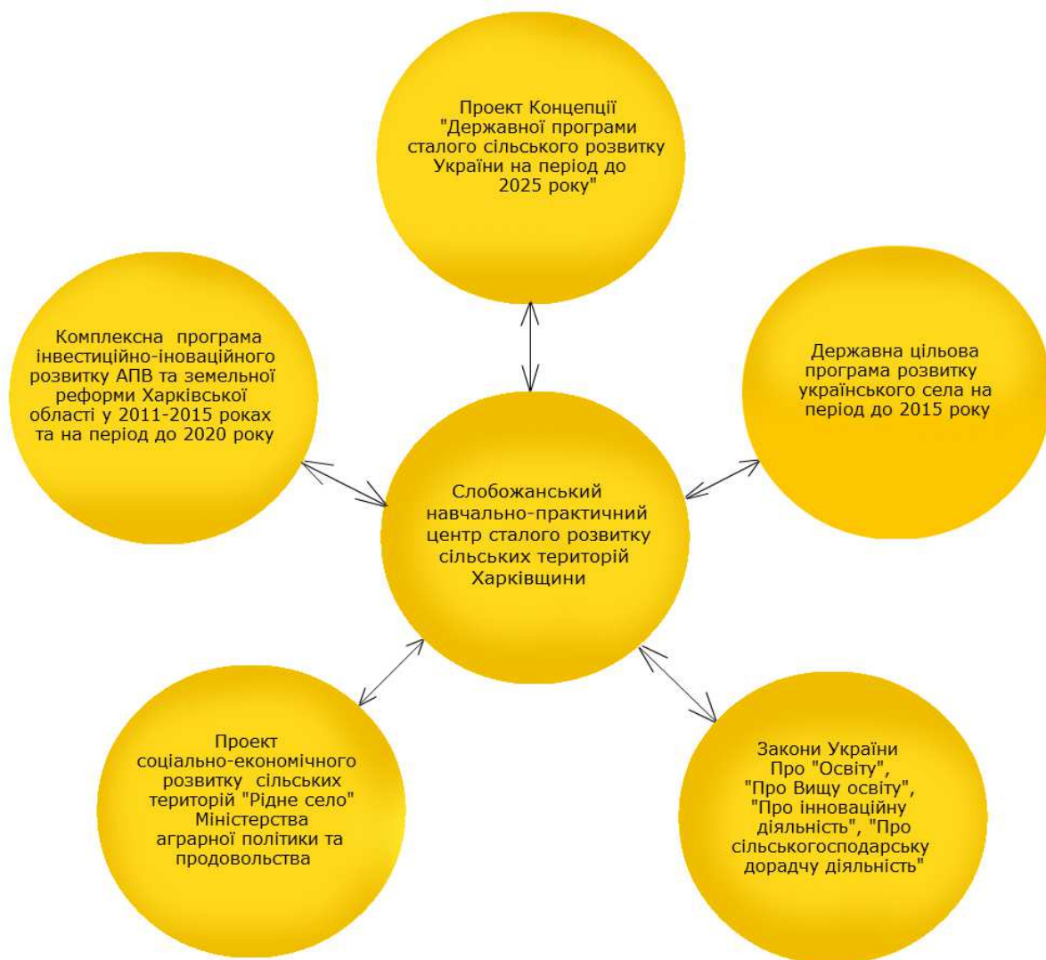
Рис.1 Інтеграційна модель нормативно-правового і духовного забезпечення діяльності Слобожанського навчально-практичного центру сталого розвитку сільських територій Харківщини