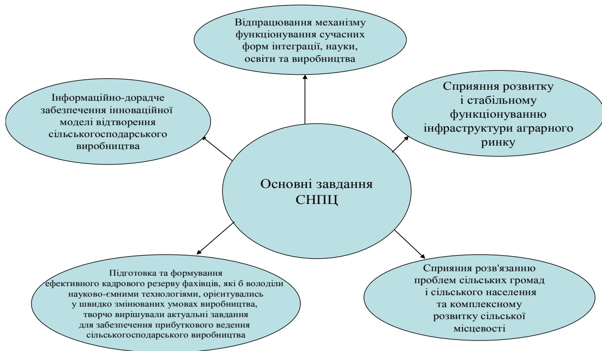
Рис.3 Основні завдання СНПЦ

Місія СНПЦ – просвітництво, дорадництво, пошук і реалізація інтеграційних форм інноваційної діяльності аграрної освіти, науки і виробництва.